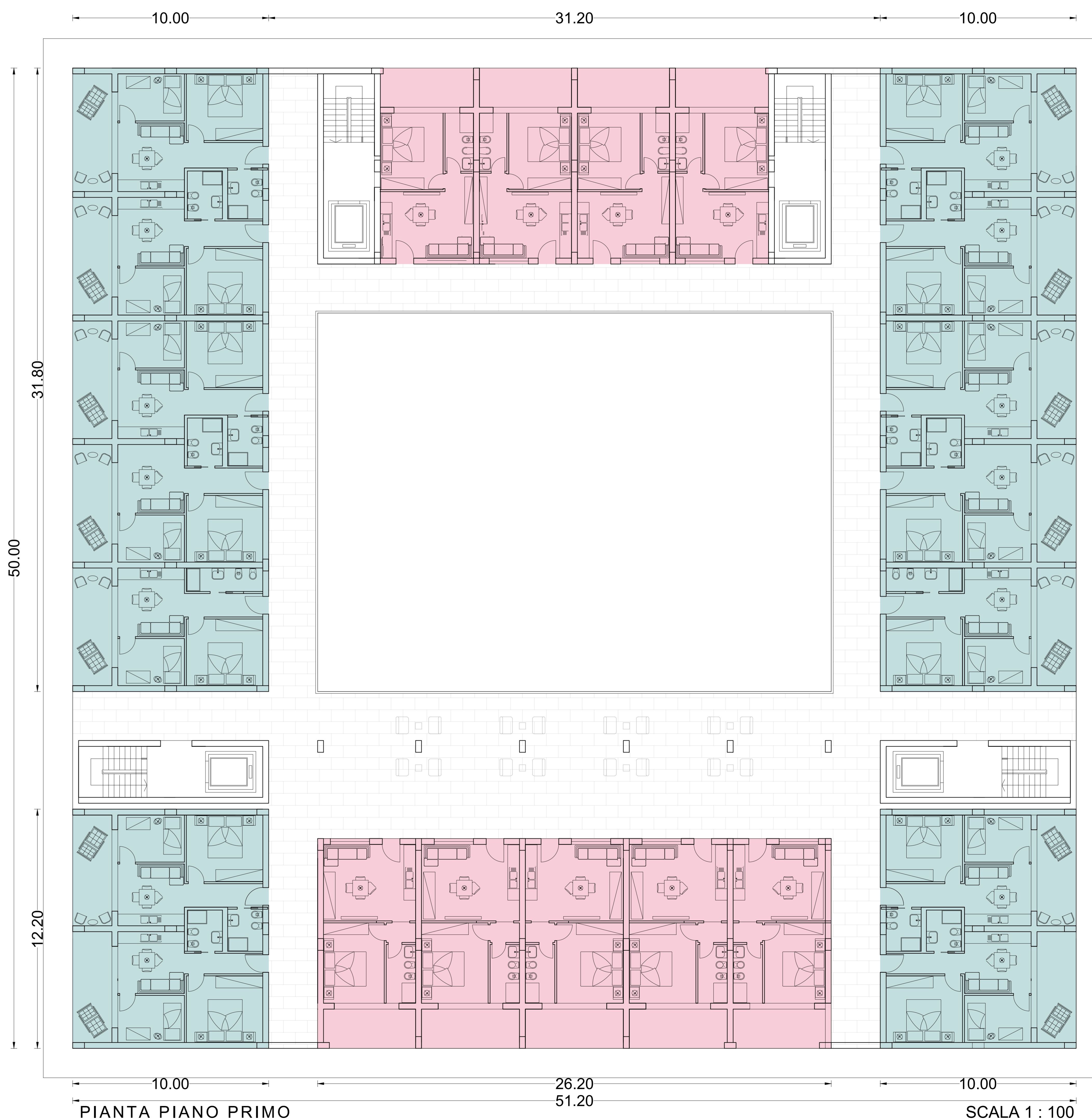
SCALA 1 : 100